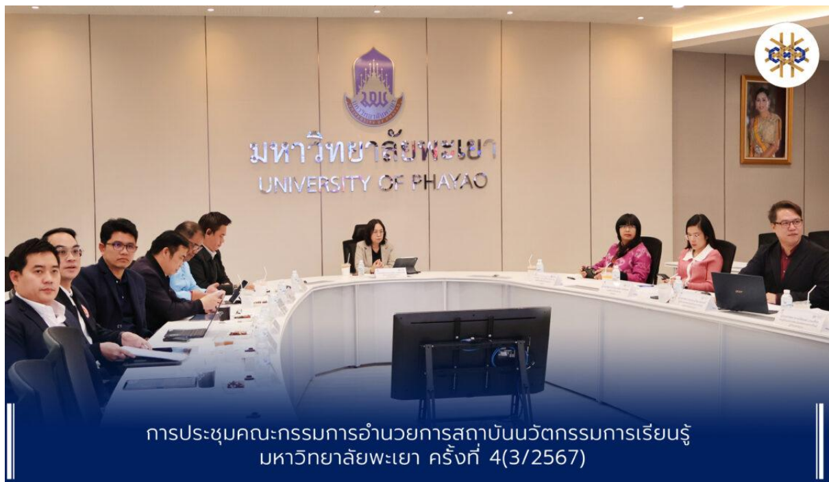
การประชุมคณะกรรมการอำนวยการสถาบันนวัตกรรมการเรียนรู้ มหาวิทยาลัยพะเยา ครั้งที่ 4(3/2567)

สถาบันนวัตกรรมการเรียนรู้ได้นำข้อเสนอแนะของคณะกรรมการอำนวยการสถาบันไปปรับปรุงการดำเนินงานด้านต่อไป