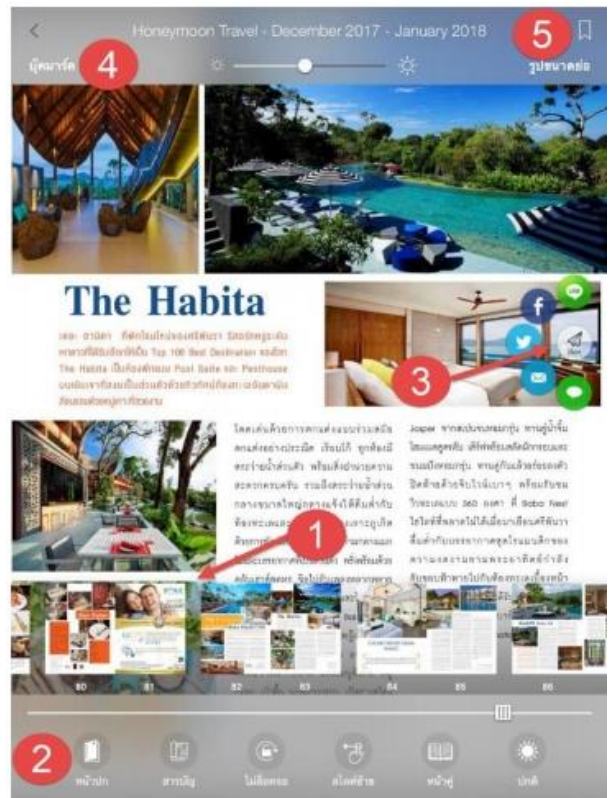
ภาพที่ 5 ตัวอย่างฟังก์ชันการใช้งานหน้าหนังสือ