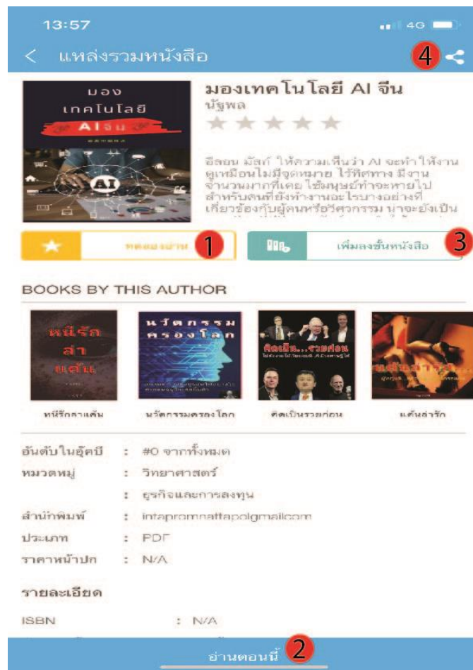
ภาพที่ 4 ตัวอย่างการใช้งานแอปพลิเคชัน OOKBEE