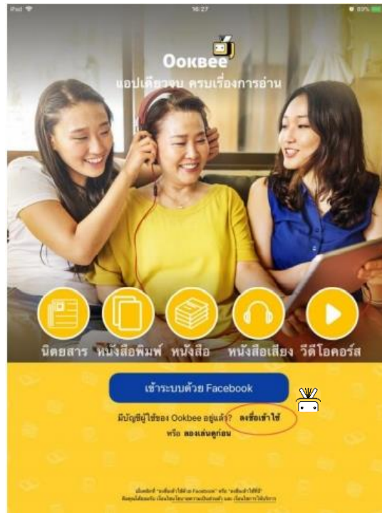
ภาพที่ 2 ตัวอย่างการลงชื่อเข้าใช้งาน

3.1 เลือกเมนู “ลงชื่อเข้าใช้” โดยกรอก Username และ Password ตามที่ได้ลงทะเบียนไว้